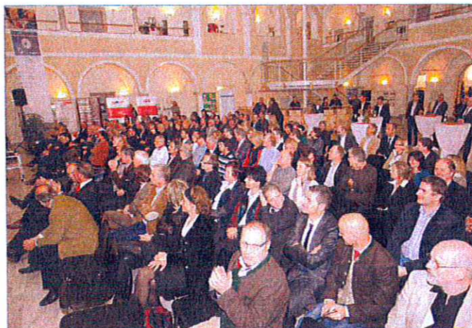
Rund 200 Gäste besuchten die Veranstaltung.